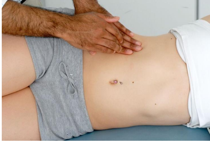
شكل ١ . ٩: الاستسقاء: قم بتحديد مكان القرع ثم اطلب من المريض أن يستلقي على جانبه واستمع لصوت القرع المتغير.

تأكد من الإصابة بالاستسقاء من خلال التحقق من الأصمية المتنقلة بالقرع والمريض مستلق على جانبه.