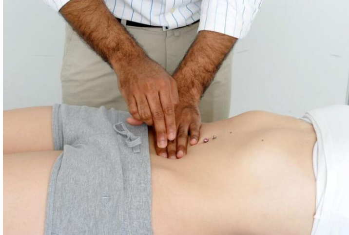
شكل ١. ٧: قرع المثانة.