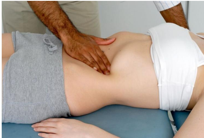
شكل ١. ٤: فحص الطحال.